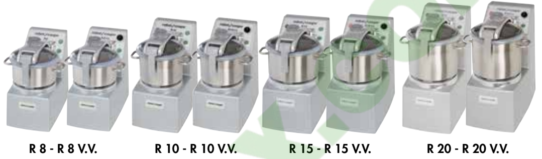
R 8 - R 8 V.V.